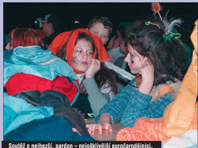
Soutěž o nejhezčí, pardon – nejošklivější euročarodějníci.