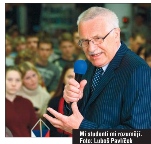
Mí studenti mí rozumějí.