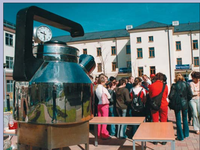
Evropa vstupem Vysočiny získala i kuriozity. Například největší čajovou konvici, která se představila na nádvoří sídla kraje.