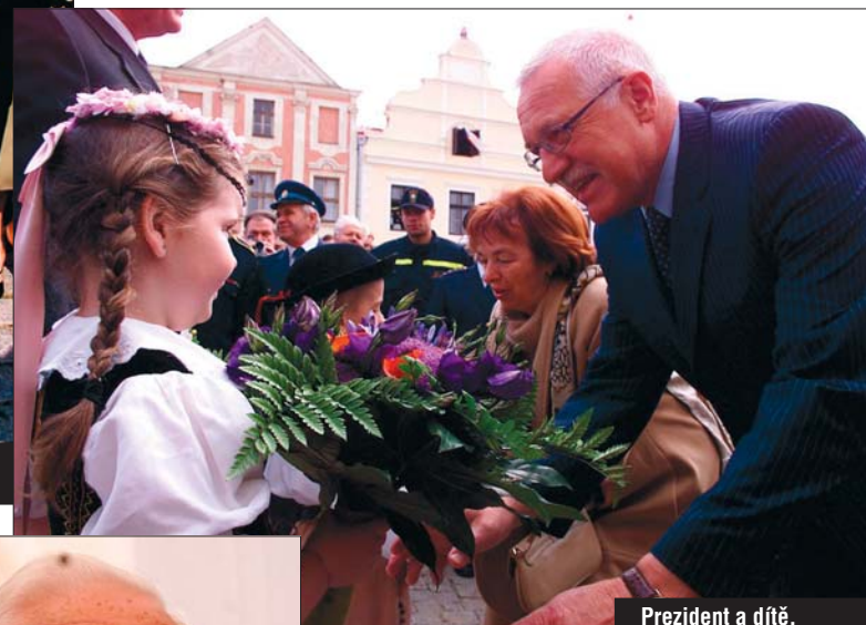
Prezident a dítě.