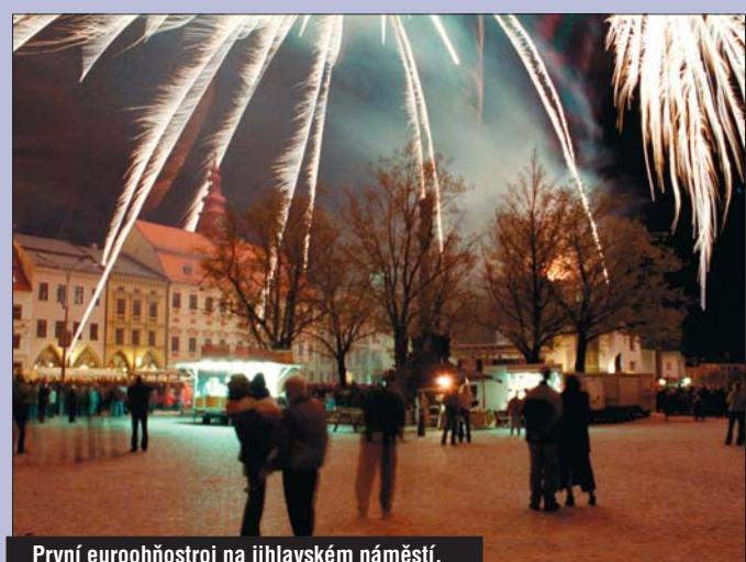
První euroohňostroj na jihlavském náměstí.

Návrat do Evropy lidé oslavili v sídle kraje i na jihlavském náměstí ■ Prezident viděl také Želiv, Telč, Jihlavu a Chotěboř ■ Vítaly jej davy lidí