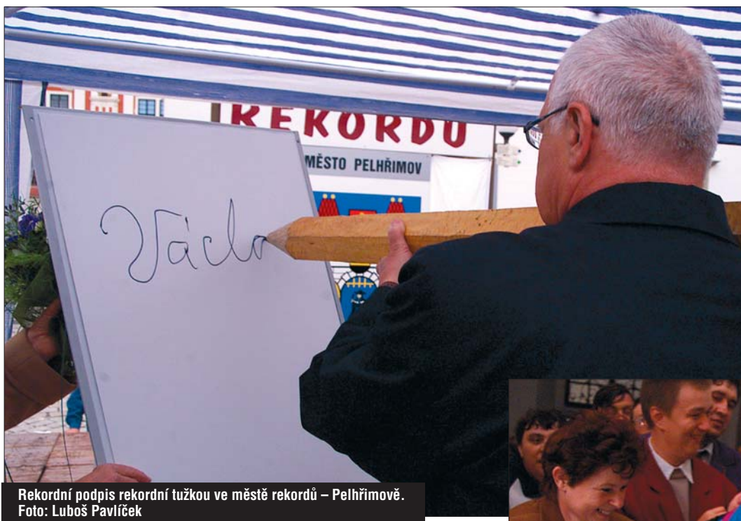
Rekordní podpis rekordní tužkou ve městě rekordů – Pelhřimově.