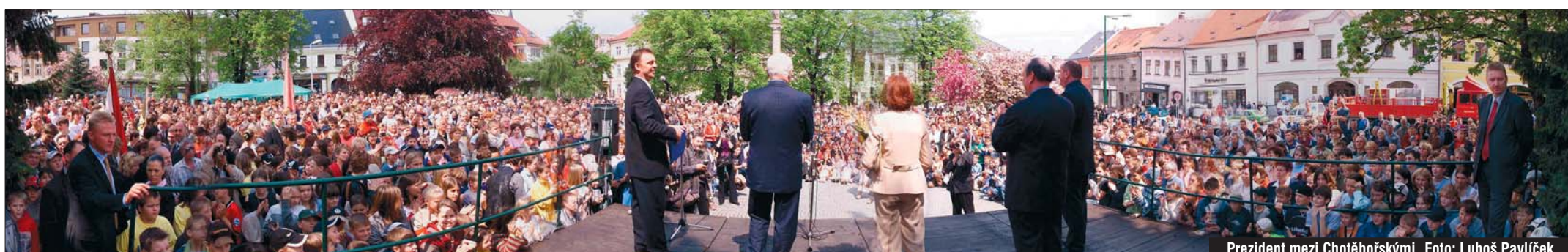
Prezident mezi Chotěbořskými.